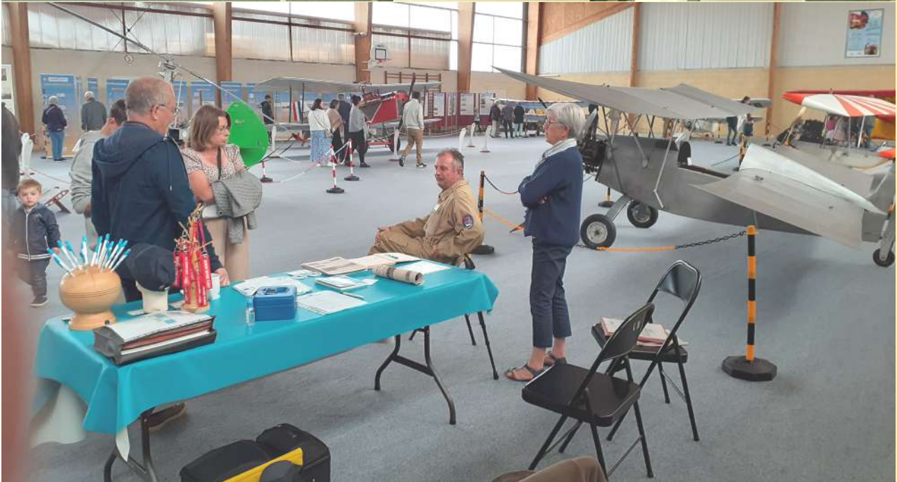
Ci-dessus : la salle principale avec les 10 aéronefs et le À gauche : un extrait des documents fournis par les habitants, pour l'expo sition.