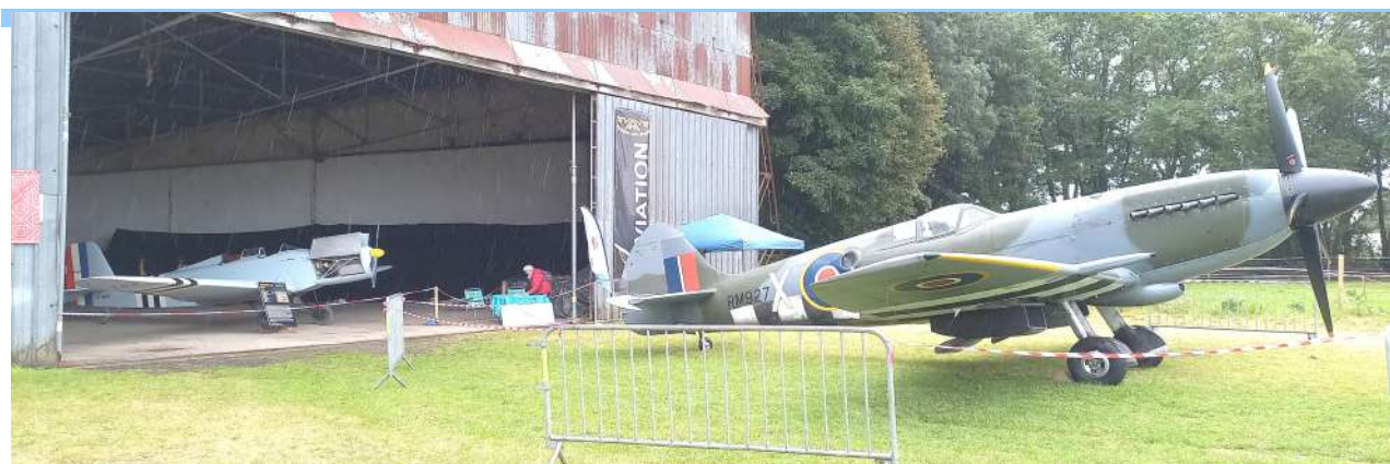
Le SPITFIRE Mk XIV en compagnie de notre MAUBOUSSIN 129