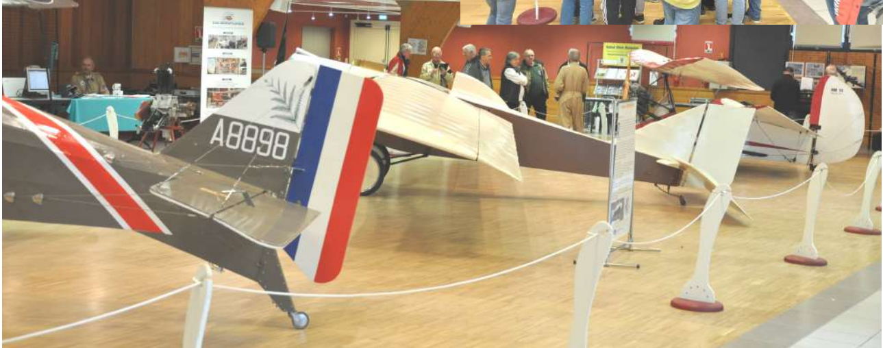
Vue du « parking avions », l'avionnette PEYRET en bonne place au centre de la salle, le HM14 au fond, et l'arrière du SE5 en premier plan.