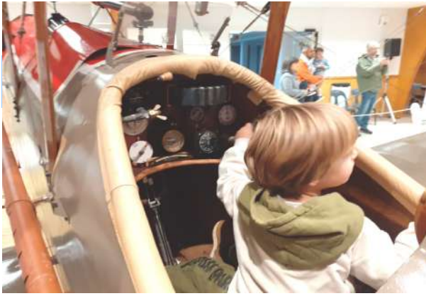
Des jeunes, voire très jeunes candidats pilotes, comme à chacune de nos expositions.