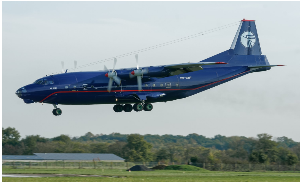
ANTONOV An12 UR-CNT Ukraine Air Alliance Le 2 novembre 2017