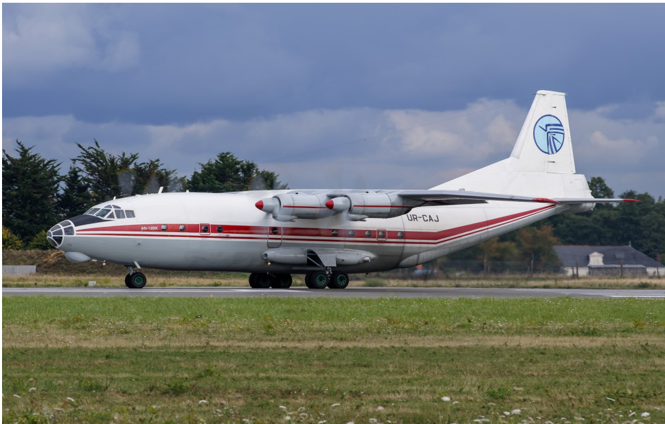
ANTONOV An12 UR-CAJ Ukraine Air Alliance Le 9 août 2017

Un certain nombre de vols cargo ont été assurés par des Antonov 12 sur Nantes durant le second semestre 2017. La venue de type d'appareil quadrimoteur était assez rare depuis de nombreuses années. Les spotters s'en sont donc donnés à cœur joie !