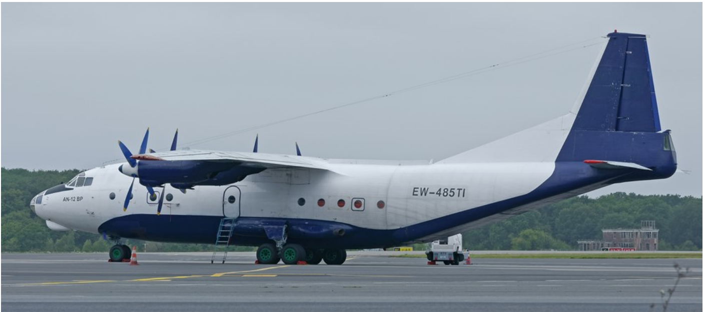
ANTONOV An12 EW-485TI - RUBY STAR - Le 13 septembre 2017