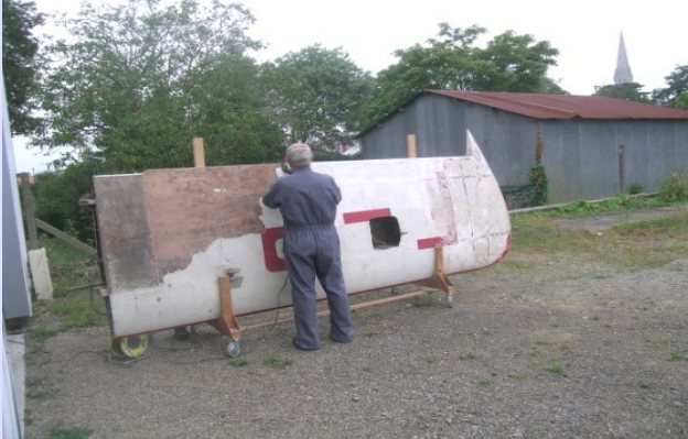
Gilles s'atèle au décapage

La restauration du RL 19 continue. Les deux ailes ont été décapées puis réparées. Les nombreuses imperfections ont été atténuées par la pose d'un enduit puis d'une couche d'apprêt. Pour ce dernier, il a été appliqué près de 5 kg par aile qu'il a fallu ensuite poncer !