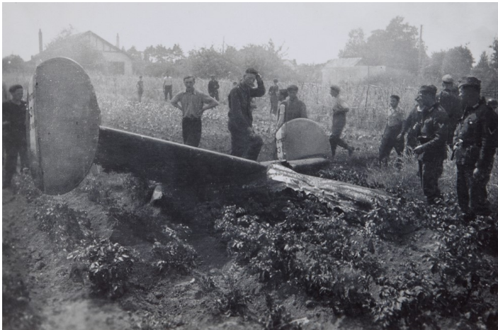
A droite : 21 juin 1940, à Saint-Sébastien –sur-Loire, le Potez 63-11 numéro 489, du GR11/52, avec pour équipage le lieutenant Marty, le sous-lieutenant Augé et le sergent Thierry, est abattu par la flak. Une cérémonie en souvenir des trois membres d'équipage a lieu, tous les ans, Place des ailes à Saint-Sébastien-sur-Loire.