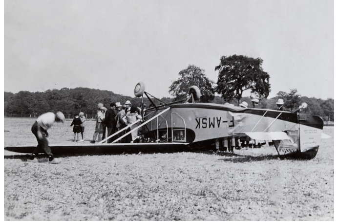
A Saint-Mars-La-Jaille, le 13/09/1934, le Caudron Phalène F-AMSK, assurant la liaison estivale Paris-La Baule, est contraint de se poser du fait d'un brouillard tenace. En redécollant l'après-midi vers sa destination initiale, il capote du fait d'un terrain trop meuble.