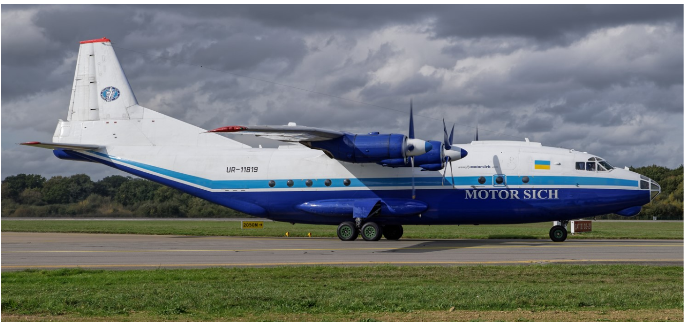
ANTONOV An12 UR-11819 - MOTOR SICH - Le 19 octobre 2017