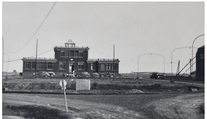
Images des débuts de l'occupation allemande. datant de 1940 ou 1941 Le bâtiment de commandement (qui reste encore de nos jours visible) et le hangar double-tonneau qui a été détruit pour cause de vétusté en mars 2012. A noter la présence d'un Me 108 Taifun et le nez d'un Henschel 126.