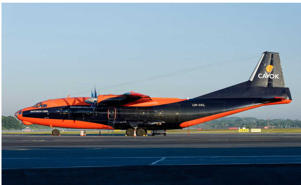
ANTONOV An12 UR-EKL CAVOK Le 15 septembre 2017