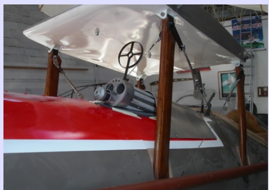
La mitrailleuse Vickers