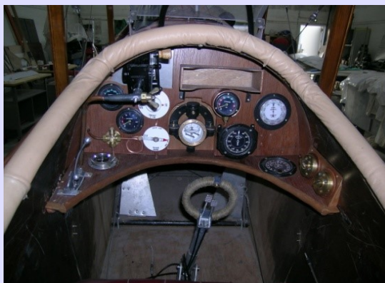
Le tableau de bord version 1917