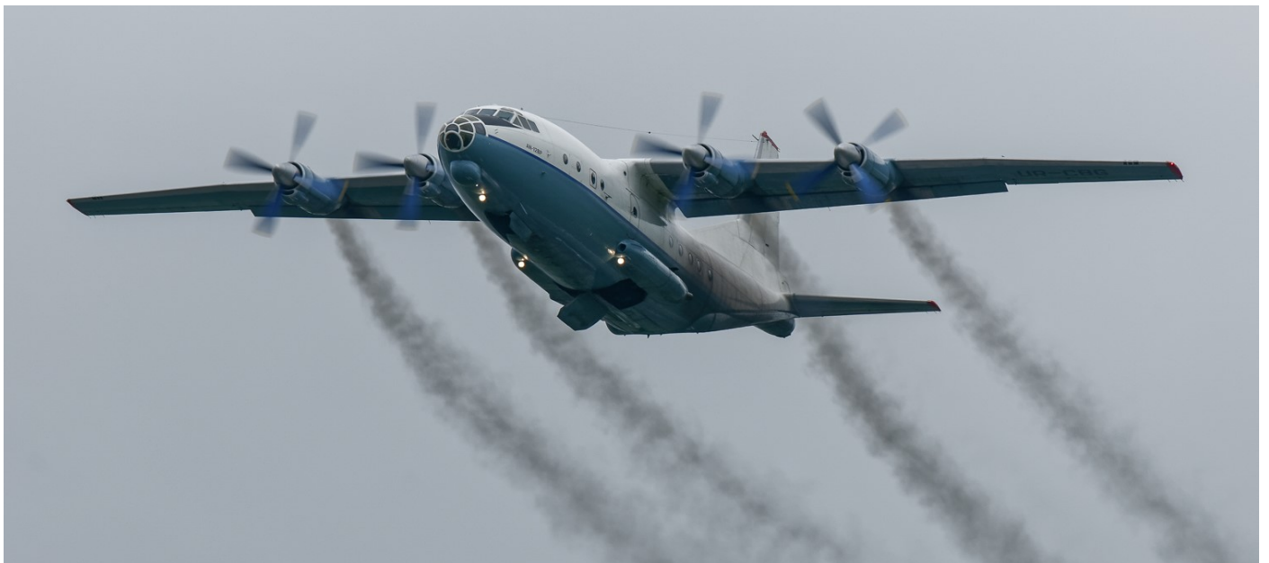
ANTONOV An12 UR-BCG - CAVOK - Le 9 octobre 2017